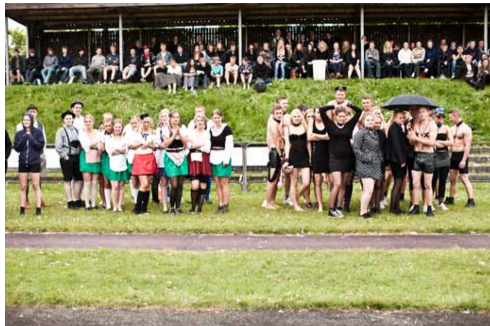
Over halvdelen af skolens elever er mødt op for at overvære 3.g'ernes sidste skoledag. 3.g'erne var klædt ud klassevis med forskellige temaer, og 3.z tiltrak sig meget opmærksomhed med deres swinger-tema i lak og læder.

På Netavisen 16.30's hjemmeside: www.aarhus11.mediajungle.dk kan du se hele billedserien fra sidste skoledag på Risskov Gymnasium.